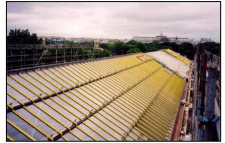
La toiture laiton en cours de vitrification

Le projet a été réalisé en 2 étapes : le verre a d'abord été remplacé sur une longueur de 50 mètres. Cette première étape a nécessité la pose préalable d'un toit de protection sous la toiture principale pendant la durée des travaux : la section concernée surplombait en effet Les Nymphéas de Monet, qui ne pouvaient être déplacées sous aucun prétexte. La seconde section de 50 mètres n'a pas exigé de telles mesures de préservation et sa rénovation a été plus aisée.