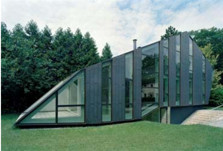
Privathaus in Berlin, Lichterfelde West HamannPottArchitekten.de 07.2005

Située dans le quartier résidentiel de Lichterfelde, le projet de la maison « Haus W. » repose sur l'idée qu'un lieu d'habitation doit être à la fois durable, original et agréable à vivre.