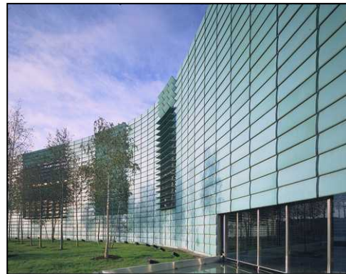
Berger+Parkkinen Architekten, Wien Photographe : Christian Richters, Münster

Implanté tout près du Tiergarten, au cœur du quartier diplomatique, le complexe immobilier des ambassades nordiques répond ainsi au mot d'ordre : « 1 family, but 5 individuals ». Symbolisant l'harmonie et l'unité scandinave, une enceinte de cuivre pré-patiné de 15 mètres de haut et de 250 mètres de long entoure l'ensemble des bâtiments et les transforme en un vaste complexe à l'échelle du centre urbain de Berlin. Les 4 000 persiennes de l'enceinte révèlent ou dissimulent l'intérieur, au gré de leur ouverture.